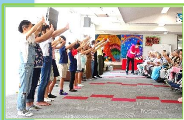
皆様 子供たちに合わせて歌われ とても楽しそう でいらっしやいました