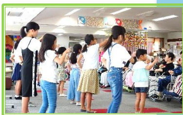
「パプリカ」振付を教え合いながら 一生懸命 練習しました