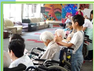
「肩たたき」の歌にあわせて 肩たたきタイム！ たたき具合は いかがですか？